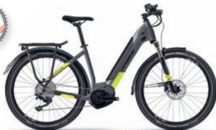
HAIBIKE TREKKING 6 LOWSTEP Yamaha PW-SE 70Nm Yamaha 500Wh