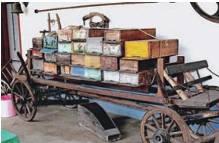
Voz, s katerim so nekoč vozili čebele na pašo