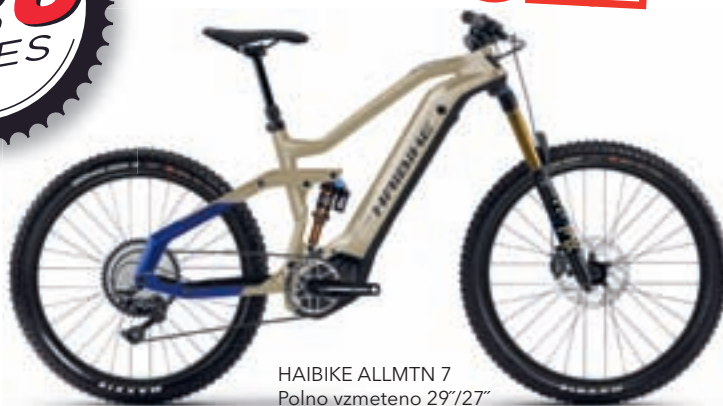
HAIBIKE ALLMTN 7 Polno vzmeteno 29"/27" Yamaha PW-X2 80Nm Yamaha 600Wh