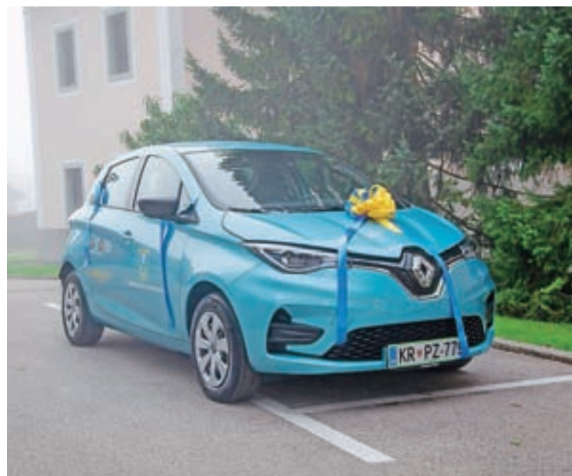
Vozilo, s katerim v Cerkljah opravljajo prevoze za starejše