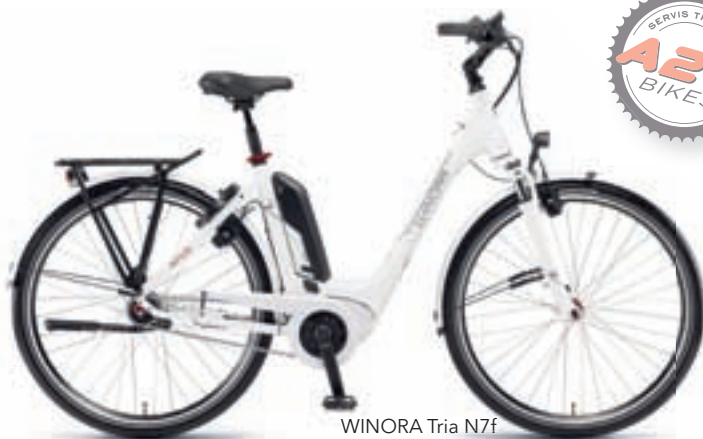
WINORA Tria N7f BOSCH Active Plus 50Nm BOSCH 400Wh