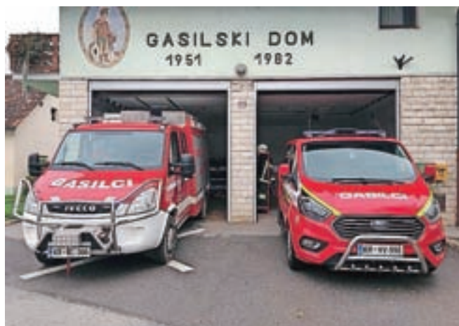
Levo je vozilo za prevoz moštva gasilcev s Spodnjega Brnika in Vopovlje.

Posodobljen voznik park in oprema pomenita večjo učinkovitost in izboljšanje varnosti vseh uporabnikov vozil ter hkrati tudi večjo varnost občanov, še pravijo cerkljanski gasilci, ki se za finančno pomoč zahvaljujejo Občini Cerklje in Gasilski zvezi Cerklje, podjetjem, ki namenjajo donacijska sredstva, ter občanom, ki s prostovoljnimi prispevki omogočajo njihovo delovanje.