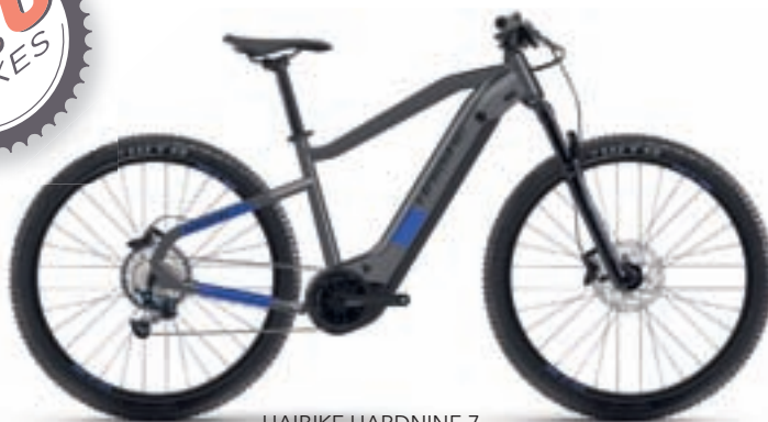
HAIBIKE HARDNINE 7 Yamaha PW-ST 70Nm InTube 630Wh