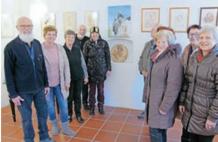
Člani društva na eni od razstav, ko je bilo tovrstno druženje še mogoče