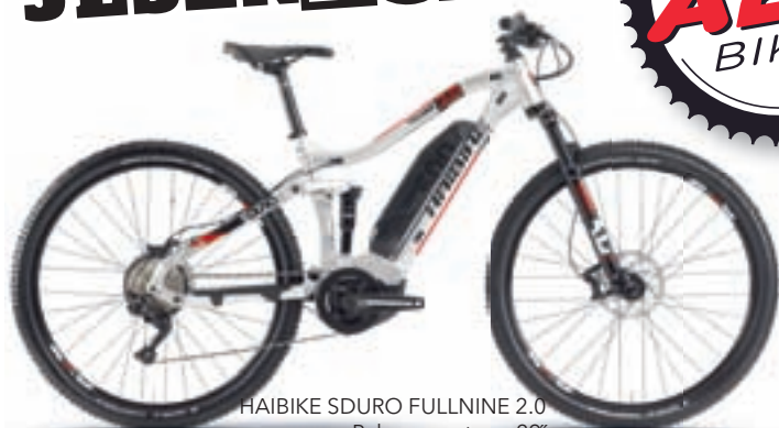
HAIBIKE SDURO FULLNINE 2.0 Polno vzmeteno 29" Yamaha PW-ST 70Nm Yamaha 500Wh