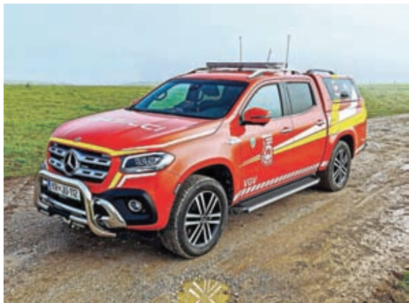
Terensko vozilo cerkljanskih gasilcev / Foto: PGD Cerklje