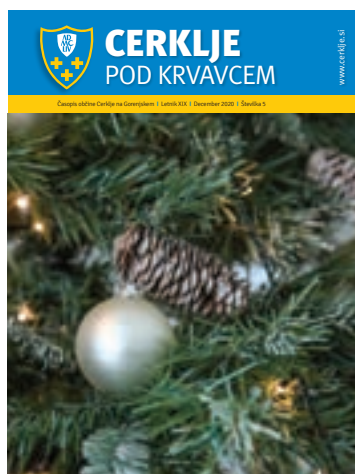
Na fotografiji: Praznično okrasje