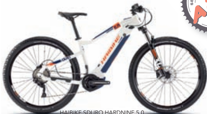
HAIBIKE SDURO HARDNINE 5.0 Yamaha PW-ST 70Nm Yamaha 500Wh